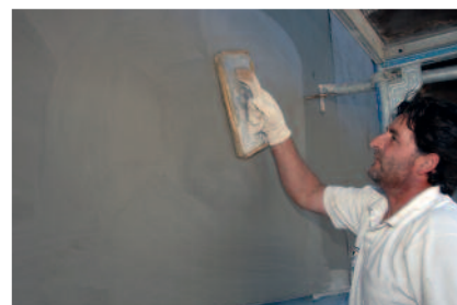
PCI Nanocret FC – L'enduit pour béton certifié pour la réparation du béton.